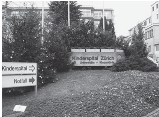
Die Umgebung des Kinderspitals ist eher unspektakulär. Spannend wirds im Innern.

Die «Chinderchile sVogelhuus» organisiert am Samstag, 28. Januar, in ihrer Reihe «Kiks Höheflüg» zwei Führungen (9.30 und 14 Uhr) im Kinderspital Zürich unter der fachkundigen Leitung einer Pflegefachfrau. Eltern von 5- bis 8-Jährigen sind mit ihren Kindern herzlich eingeladen.