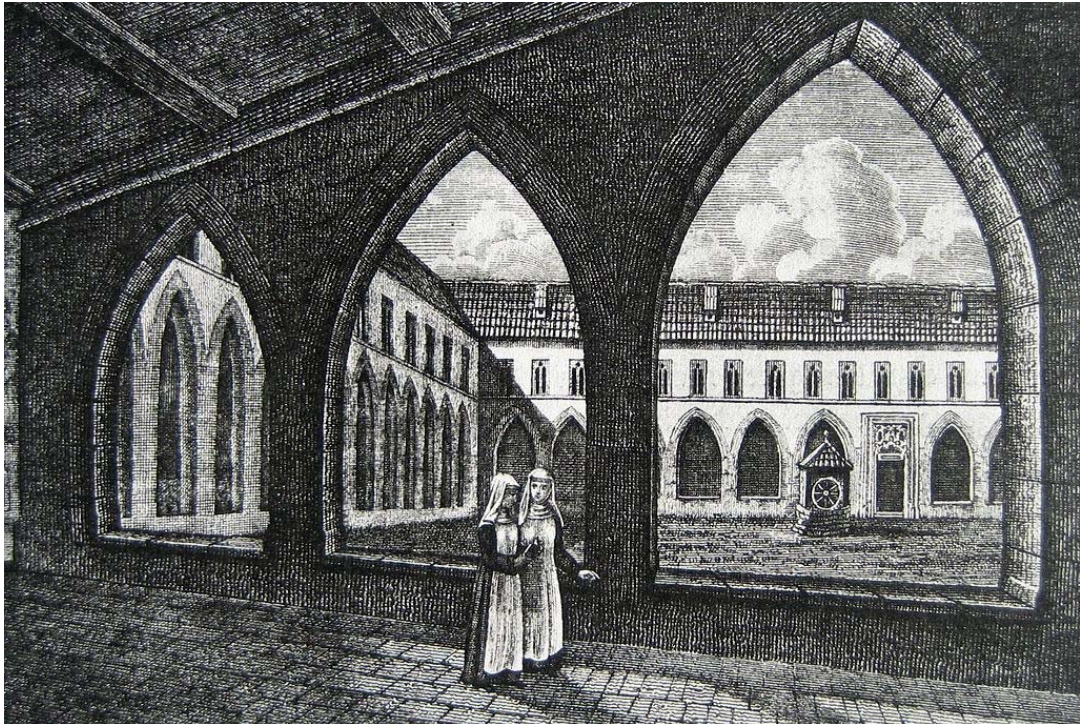
Kloster Oetenbach, Kreuzgang